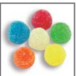
perlas de goma