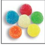
perlas de goma