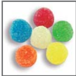
perlas de goma