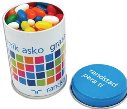
caramelo 2 lazos