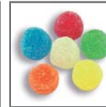
perlas de goma