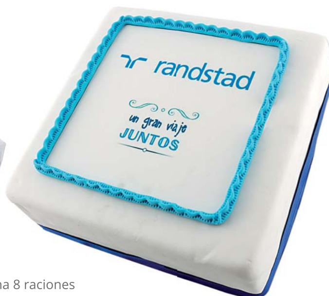
Tarta Artesana 8 raciones