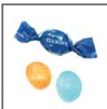
caramelos 2 lazos mini