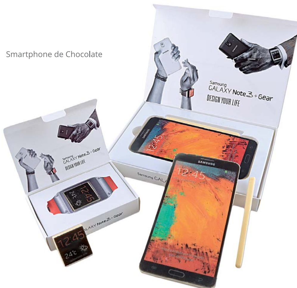
Smartphone de Chocolate

Productos desarrollados en base al destinatario, tipo de campaña, presupuesto, cantidad, etc. Adaptamos y damos forma a cualquier tipo de idea. No dude en preguntar.