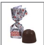
bombón 1 lazo