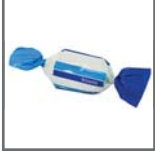
caramelo 2 lazos