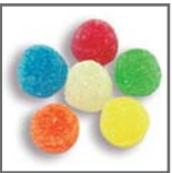
perlas de goma