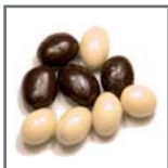
cacahuets con chocolate