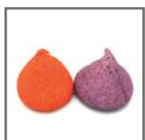
top mallow (solo en tamaño grande)