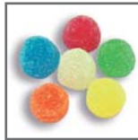
perlas de goma